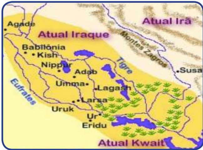
MAPA DA ANTIGA SUMÉRIA

Há 5000 anos, aproximadamente, os Sumérios habitavam na Mesopotâmia, região localizada entre os Rios Eufrates e Tigre e que, atualmente, pertence ao Iraque. Acredita-se que esse povo inventou a escrita. Naquela época, o papel ainda não tinha sido inventado e a escrita era realizada em placas de argila. Eles retiravam a argila das margens do rio Eufrates e pressionavam a placa com a ponta de uma vara conhecida como cunha (sua ponta era triangular). Esse tipo de escrita sobre as placas de argila é denominado ESCRITA CUNEIFORME .